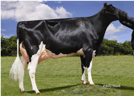
LADYS-MANOR ALLANAS DORA FIFTH DAM