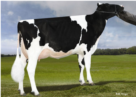
LADYS-MANOR S DAHLIA FOURTH DAM