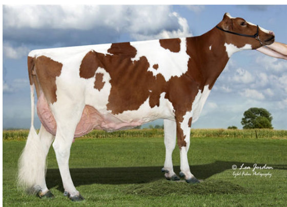
SCENERY-VIEW CELIA-RED THIRD DAM