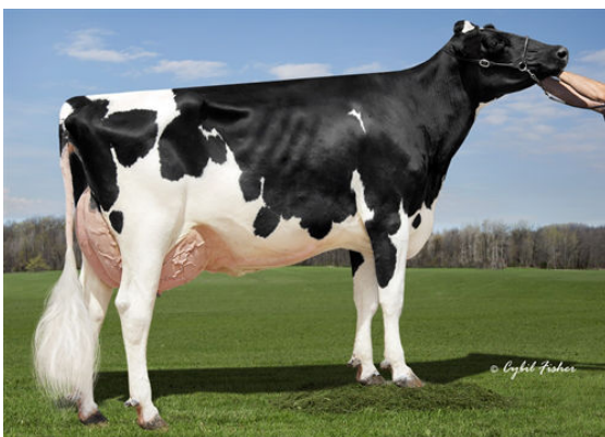
KINGS-RANSOM DELTA DESTINY GRANDDAM