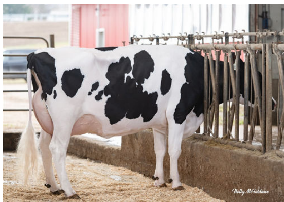
COOKIECUTTER A HOMILY GRANDDAM