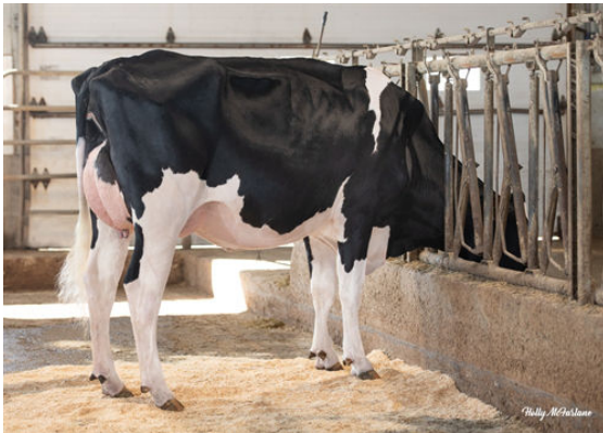
PROGENESIS RANGER KAYLYNN DAM