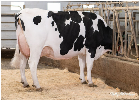
OCD LEGENDARY RAE FIFTH DAM