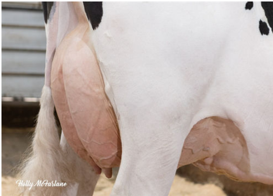
OCD LEGENDARY RAE FIFTH DAM