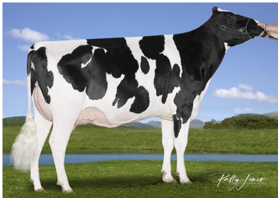
VOGUE BIGHT SERENITY PP