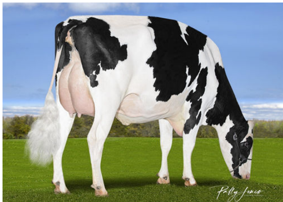
SILVERCAP LUSTER STILLNESS PP