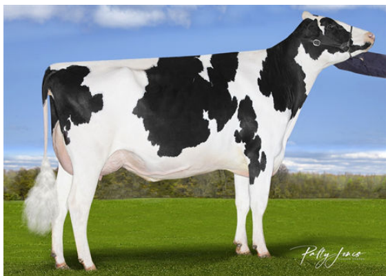
SILVERCAP LUSTER STILLNESS PP