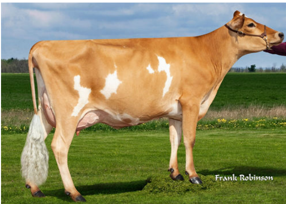
PROGENESIS CRAZE CORD {6}