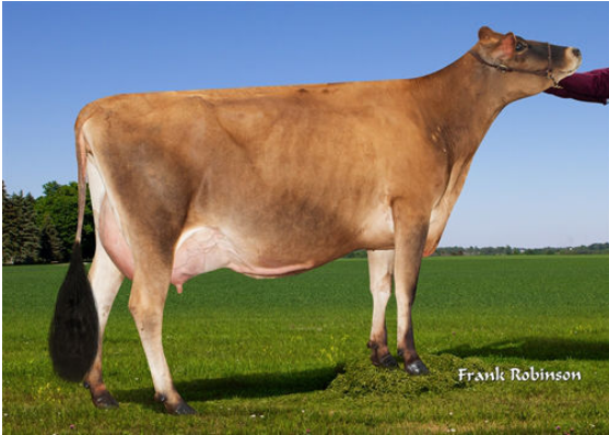
JX PROGENESIS CINDERELLA {6}