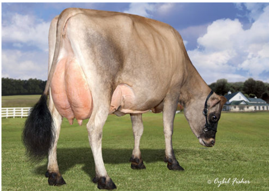
GOFF PHAROAH CIRCUS ACT