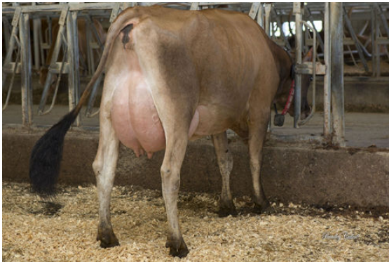
GOFF PHAROAH CIRCUS ACT