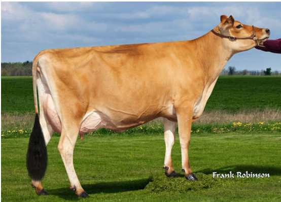
JX VIERRA PRESLEY {6} THIRD DAM