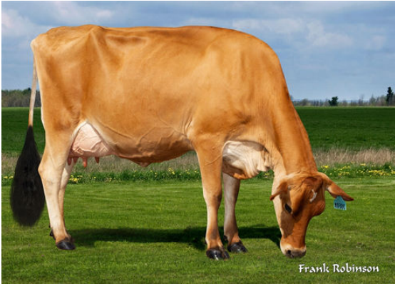
JX VIERRA PRESLEY {6} THIRD DAM