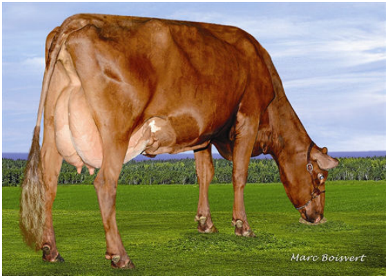
KAMOURASKA ORRA XUBY DAM

DUO STAR REVOLVER KAMOURASKA ORRA XUBY VG-85-4YR-CAN 20* ORRARYD KAMOURASKA PETERSLUND RUBY VG-87-3YR-CAN 10* PETERSLUND KAMOURASKA JERRY VIRVANA EX-90-5YR-CAN 9*