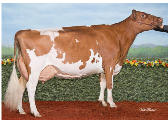
DE LA PLAINE PRIME ROCKY GRANDDAM