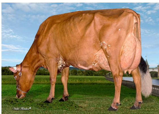
BELLEROUTE TUXEDO RIHANA DAM