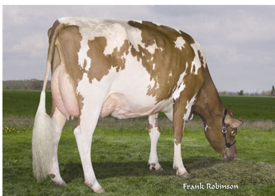
DE LA PLAINE RHYTHM ROMI THIRD DAM