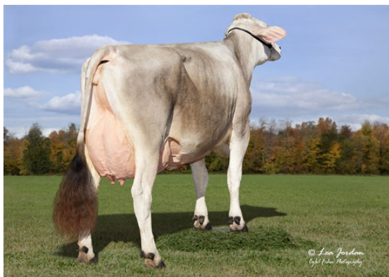
HILLTOP ACRES PRINCESS ETV DAM

HILLTOP ACRES NASHVILLE HILLTOP ACRES PRINCESS EX-92-USA HILLTOP ACRES D KICKSTART HILLTOP ACRES CAD PAULA VG-87-USA SHILOH BROOKINGS CADENCE HILLTOP ACRES BUSH DENVER GP-83-USA