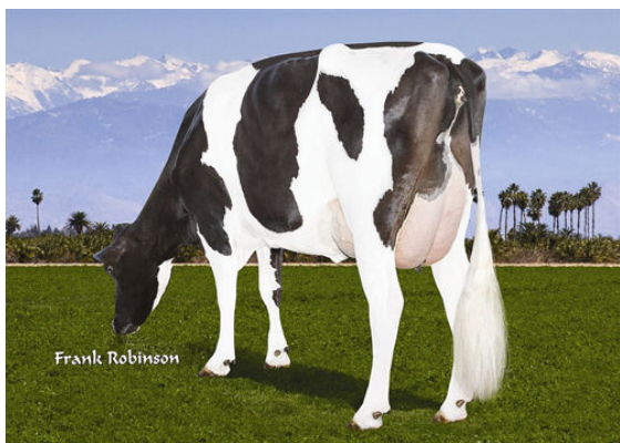
AIR-OSA HALAK 15325