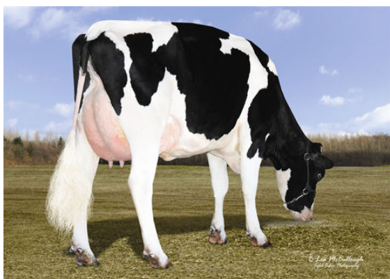
CHRIS-DA HALAK 420