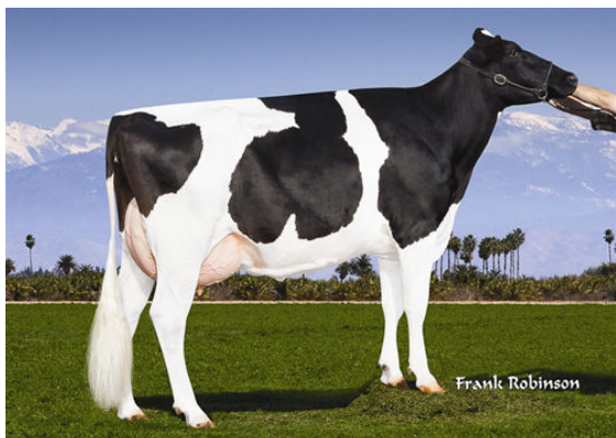
AIR-OSA HALAK 15389