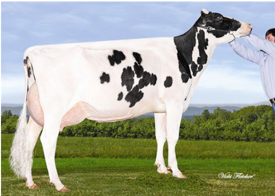
GERANETTE BOLTON LAURE DAM