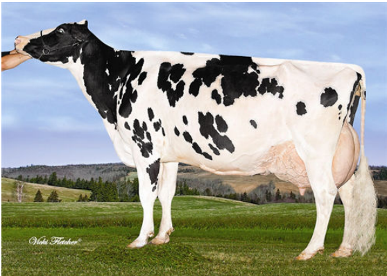
GERANETTE F B I LAURIE GRANDDAM