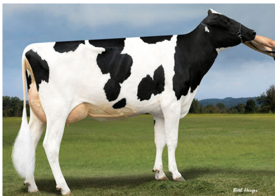
PROGENESIS JEDI HOLOCRON THIRD DAM