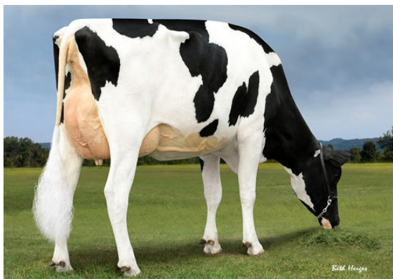
PROGENESIS JEDI HOLOCRON THIRD DAM