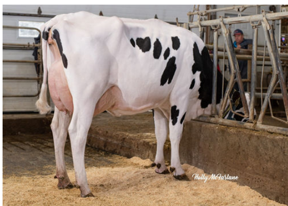
PROGENESIS TOPNOTCH MACIE FOURTH DAM