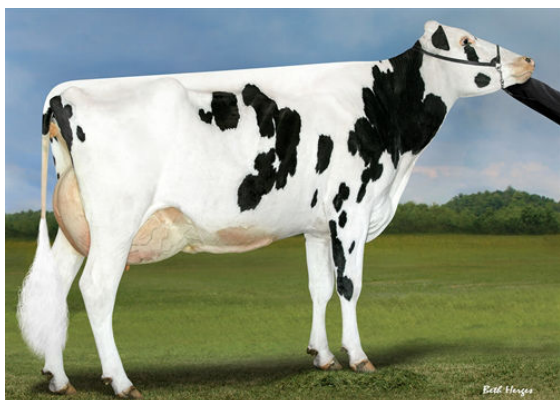
PROGENESIS DUKE MELEE FIFTH DAM