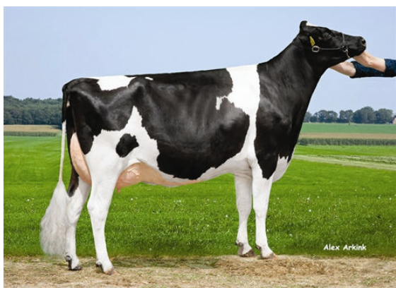
DG CALICO FIFTH DAM