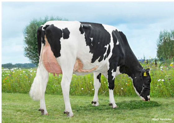
HUL-STEIN BAKERSFIELD DAM

CLAYNOOK CASTING HUL-STEIN BAKERSFIELD PROGENESIS MONTEVERDI HUL-STEIN BUTTERMILK HURTGENLEA RICHARD CHARL HUL-STEIN BUTTERFLY