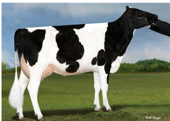
TRIPLECROWN DELTA 26