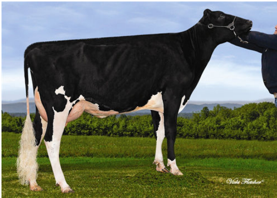
AIJA MAN O MAN NAOMI THIRD DAM