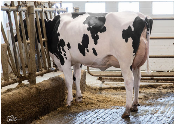
CANCO YAMASKA DREAM DAUGHTER