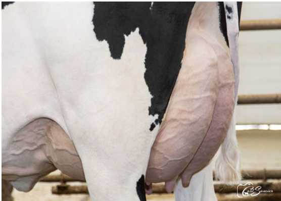
CANCO YAMASKA DREAM DAUGHTER