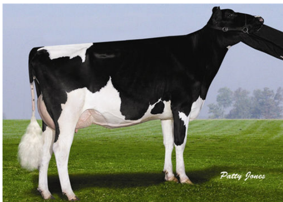
WHITTIER-FARMS HE REBECA FOURTH DAM