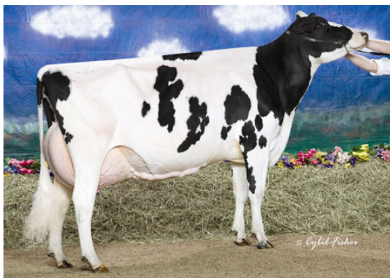
WHITTIER-FARMS OUTSIDE ROZ FIFTH DAM