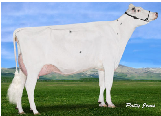
BLUE-HORIZON JCKMN BABYDUST GRANDDAM