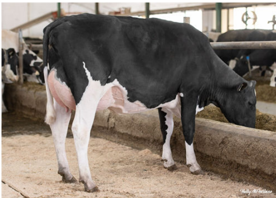
REDSTONE SUGARHIGH HARMONY DAUGHTER