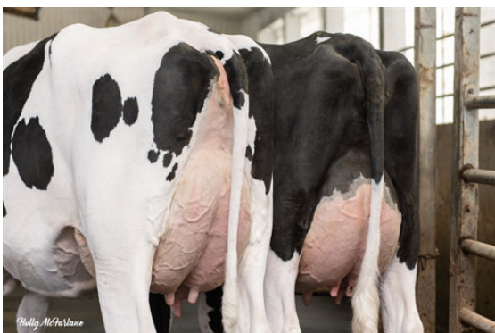
SUGARHIGH DAUGHTER GROUP

L TO R - REDSTONE SUGARHIGH GRECIA, REDSTONE SUGARHIGH HARMONY