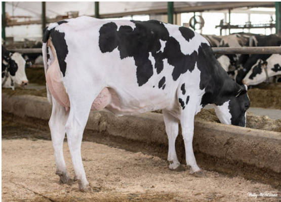
REDSTONE SUGARHIGH GRECIA DAUGHTER