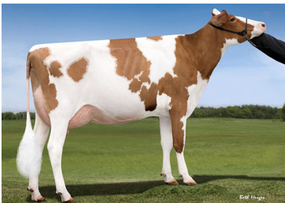
SNOWBIZ SYMPATICO SOFIA FOURTH DAM