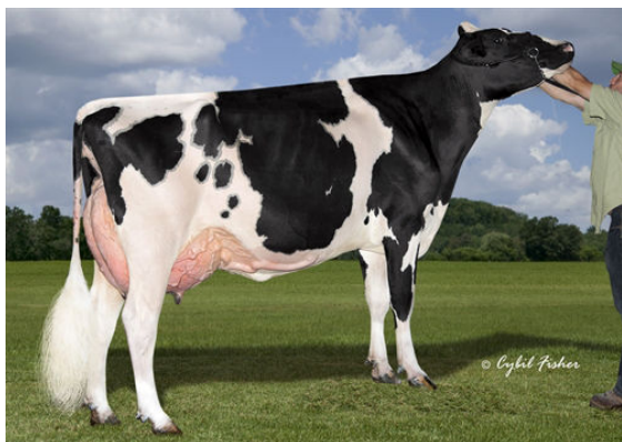
WINTERHLM-WG BAX ELATED FIFTH DAM