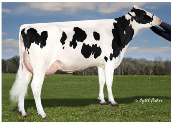
MAIN-DRAG RUBICON EMAIL THIRD DAM