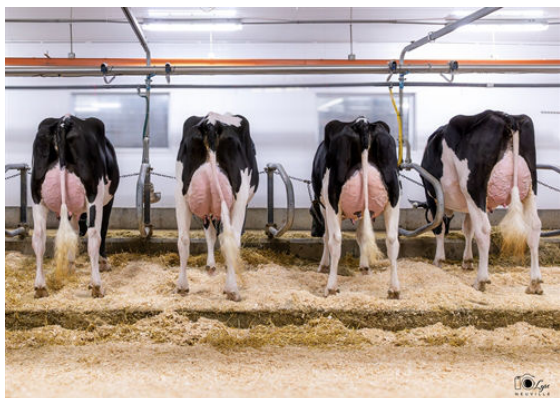
HAVENOFEAR DAUGHTER GROUP

L TO R - DUBENOIT HAVENOFEAR HOMELESS, HOLY, HELLIA, SANDY