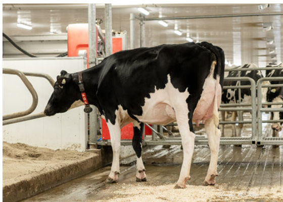
CLAYNOOK ZUNI KALAHARI DAUGHTER