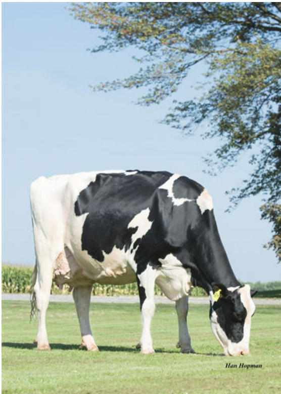
KINGS-RANSOM MG CLEAVAGE THIRD DAM