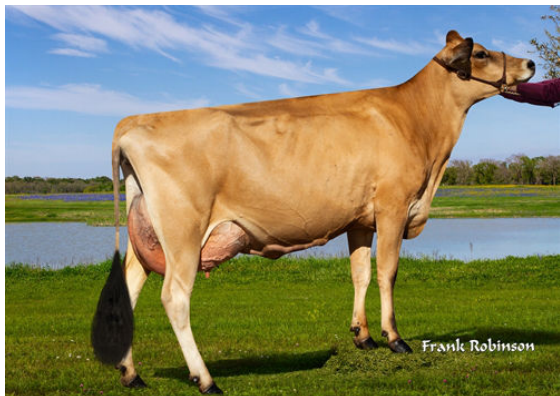
JX LUCKY HILL WILDFLOWER {6} GRANDDAM