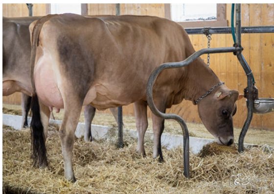
DULET JORDAN GEORGIA DAM