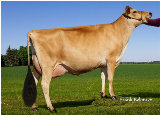
PROGENESIS MADISON- THIRD DAM