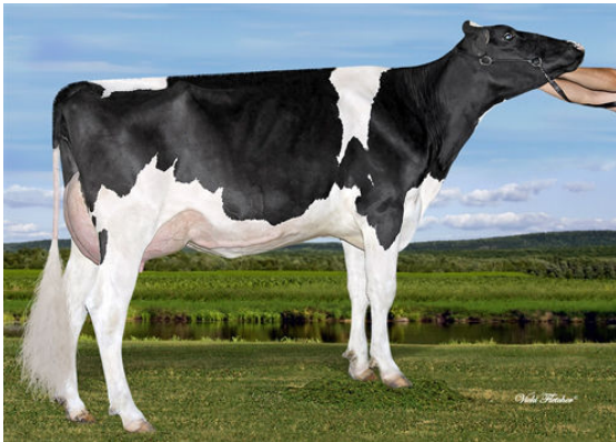
AIJA KING-DOC WICHITA DAM