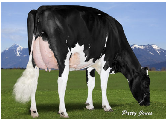
VIEW-HOME DRMAN WSCONSIN THIRD DAM