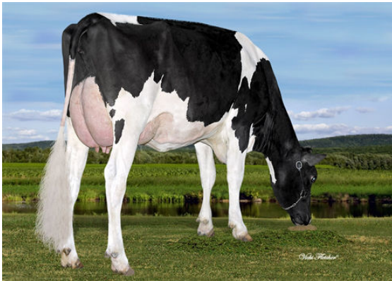
AIJA KING-DOC WICHITA DAM