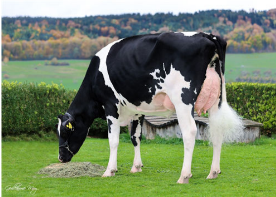
TGD-HOLSTEIN 2020 ASYBA DAM