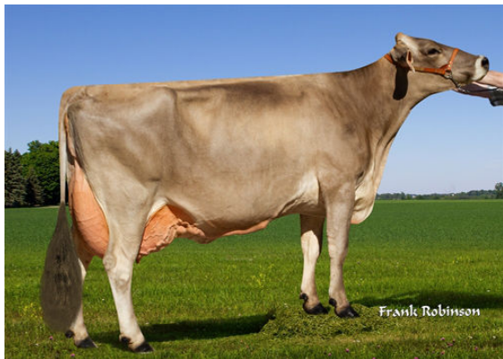
GUBELMAN BROOKINGS KATIE GRANDDAM