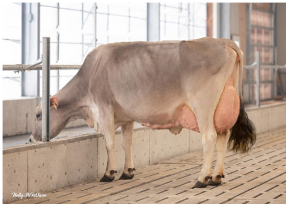
GUBELMAN BIVER KATNISS DAM