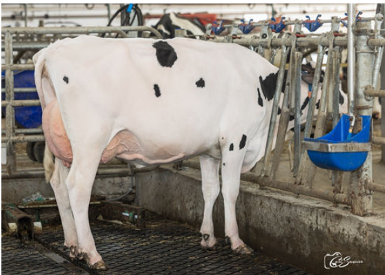
LEBAM ALLGAUD CHICKY DAUGHTER