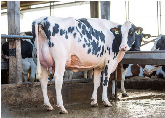
HAH ALLGAUD COLIBRI DAUGHTER