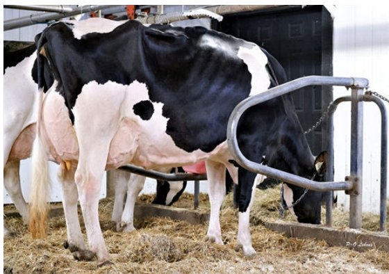
LILLIVILLE RANDALL ZOEY DAUGHTER