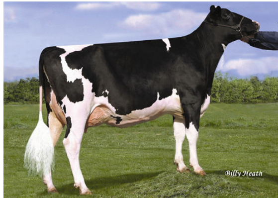
WA-DEL SUPER BATHSHEBA GRANDDAM