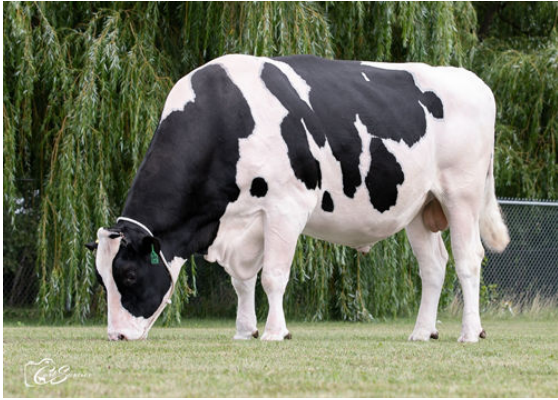
ANTIA FUEL MINOU DAUGHTER