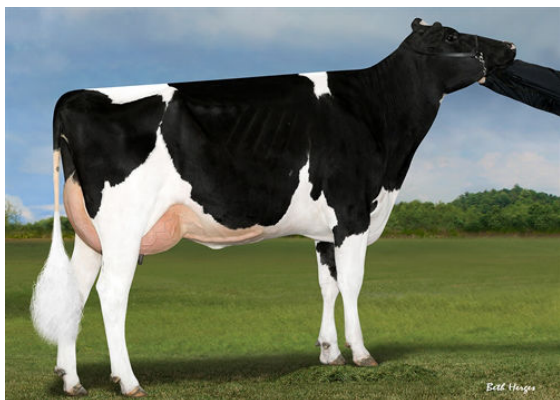
WELCOME YODER CALLO DAM