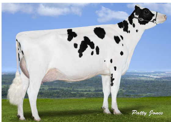
EDG DAHLIA MOGUL 2257 GRANDDAM