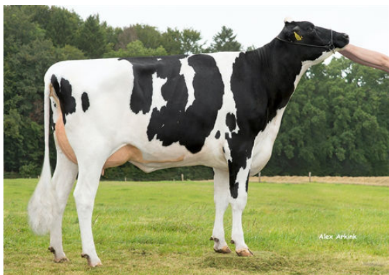
HET SC CHARLENE DAUGHTER