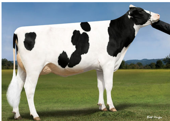
PROGENESIS MODESTY DENDRITE DAM