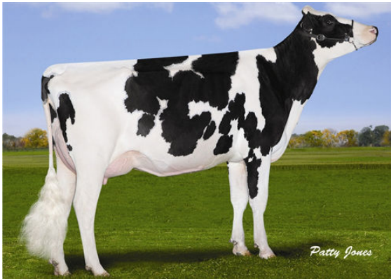
GEN-I-BEQ SNOWMAN SUMMER FOURTH DAM