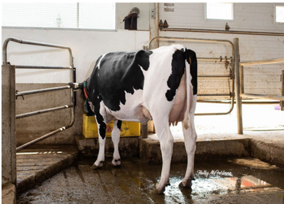
PROGENESIS TOPNOTCH GARNET DAM