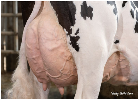
WESTCOAST ALCOVE RIZA 7512 DAM