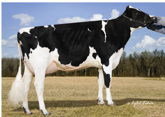
FLY-HIGHER BOLTON MISHA FIFTH DAM