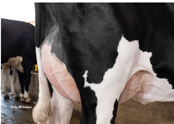
PROGENESIS OUTL WINTERBERRY GRANDDAM