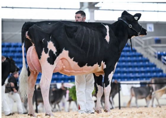
PETITCLERC BULLSEYE ABELIA DAUGHTER