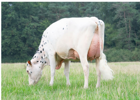
SEIPELS BULLSEYE KAYLEE DAUGHTER