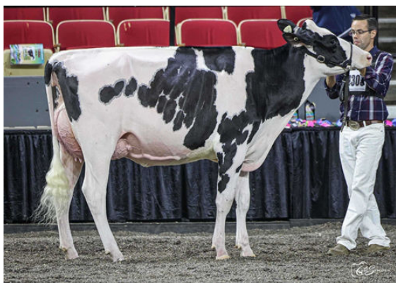
MARTIN-VIEW BULLSEYE CROSBY DAUGHTER