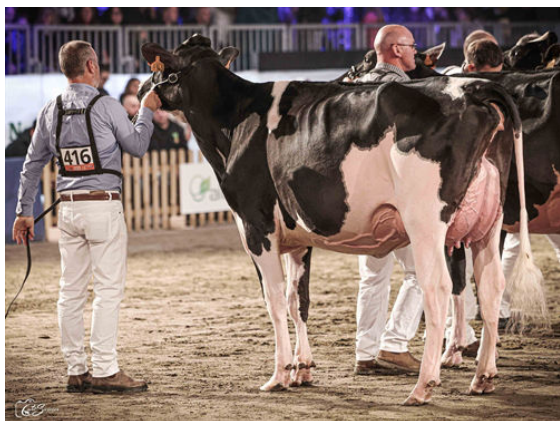
TOC-FARM HAVENOFEAR RIA DAUGHTER