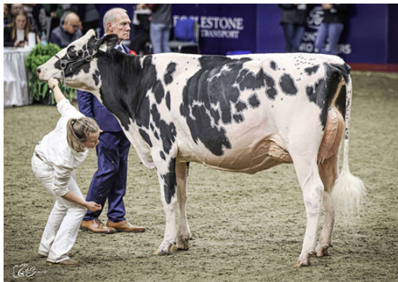
JACOBS HAVENOFEAR SHE-RA DAUGHTER